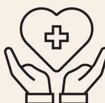
HELSE OG LIVSMESTRING